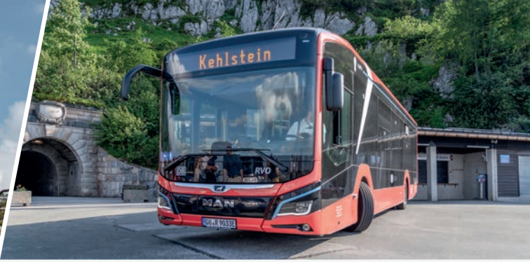
E-Bus auf der Buswendeplattform direkt unterhalb des Kehlsteinhauses Electric bus parked at the turn-around point directly below Eagle's nest.

» EIN PANORAMABLICK ZUM NIEDERKNIEN - DER AUSFLUG ZUM KEHLSTEINHAUS BEEINDRUCKT DIE GANZE FAMILIE.