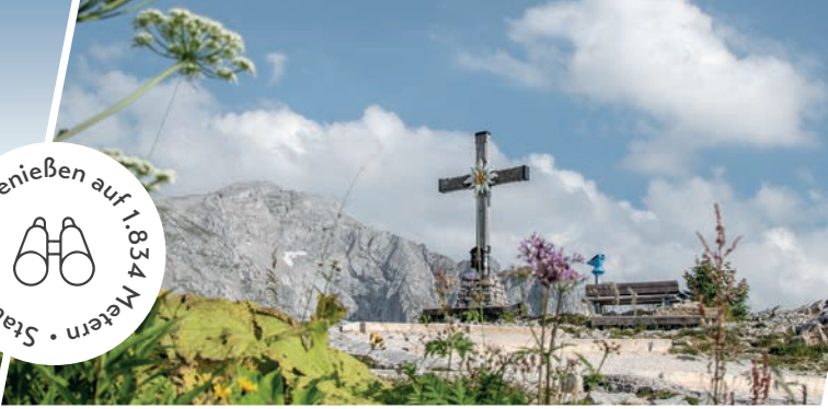
Das Gipfelkreuz ist vom Kehlsteinhaus aus in fünf Minuten erreichbar. The summit cross can be reached in five minutes from the Kehlsteinhaus.