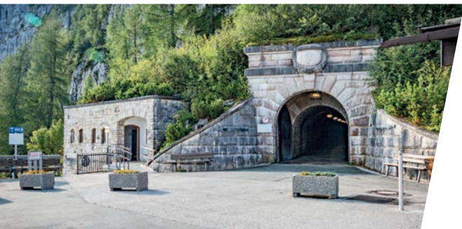
Ein beleuchteter Tunnel führt zum Aufzug im Berg. An illuminated tunnel leads to an elevator inside the mountain.

Seit 1952 wird das Gebäude als Berggaststätte genutzt und wurde zu einem beliebten Ausflugsziel. Der Bau ist bis heute weitgehend original erhalten, während fast alle anderen Gebäude aus der NS-Zeit am Obersalzberg verschwunden sind. Eine Ausstellung informiert über die Geschichte des Kehlsteinhauses und seine Verbindung zu Hitler und dem Obersalzberg.